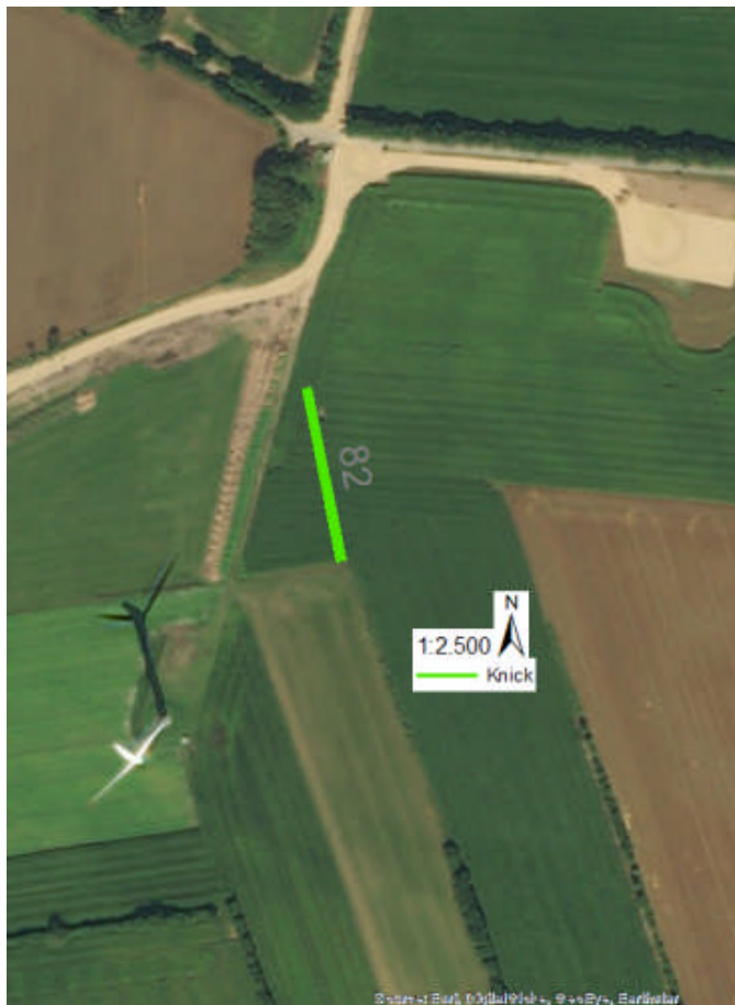
Abbildung: Knickneuanlage Flurstück 6, Flur 8 in der Gemarkung Ellerdorf

Das Pflanzgut hat den Qualitätsmerkmalen des Bundes Deutscher Baumschulen zu entsprechen. Danach haben die Bäume (unterstrichenen Pflanzen der obigen Auflistung) der BdB-Pflanzqualität „2 x verpflanzt, ohne Ballen, 100 cm bis 125 cm“ und die Sträucher der Pflanzqualität „4- 5 triebig“ zu entsprechen. Das Verhältnis zwischen Sträuchern und Bäumen hat 3:1 zu betragen. Der Knick ist 2- reihig (Reihenabstand 1 m) gegeneinander versetzt mit einem Pflanzabstand in der Reihe von 0,80 m zu bepflanzen. Auf 10 lfd. m sind 25 Pflanzen zu pflanzen. Zum Schutz gegen Wildverbiss ist der Knick mit einer Einfriedung zu versehen, die nach dem endgültigen Anwachsen der Gehölze zu beseitigen ist. Der Erdwall ist mit einer Schicht Stroh oder Schreddergut gegen übermäßige Verkrautung und Austrocknung abzudecken. Während der ersten drei Jahre nach der Pflanzung haben Sie dafür zu sorgen, dass die Gehölze anwachsen und sich entwickeln können. Die Gehölze sind einmal jährlich frei zu mähen. Der Einsatz chemischer Mittel ist untersagt.